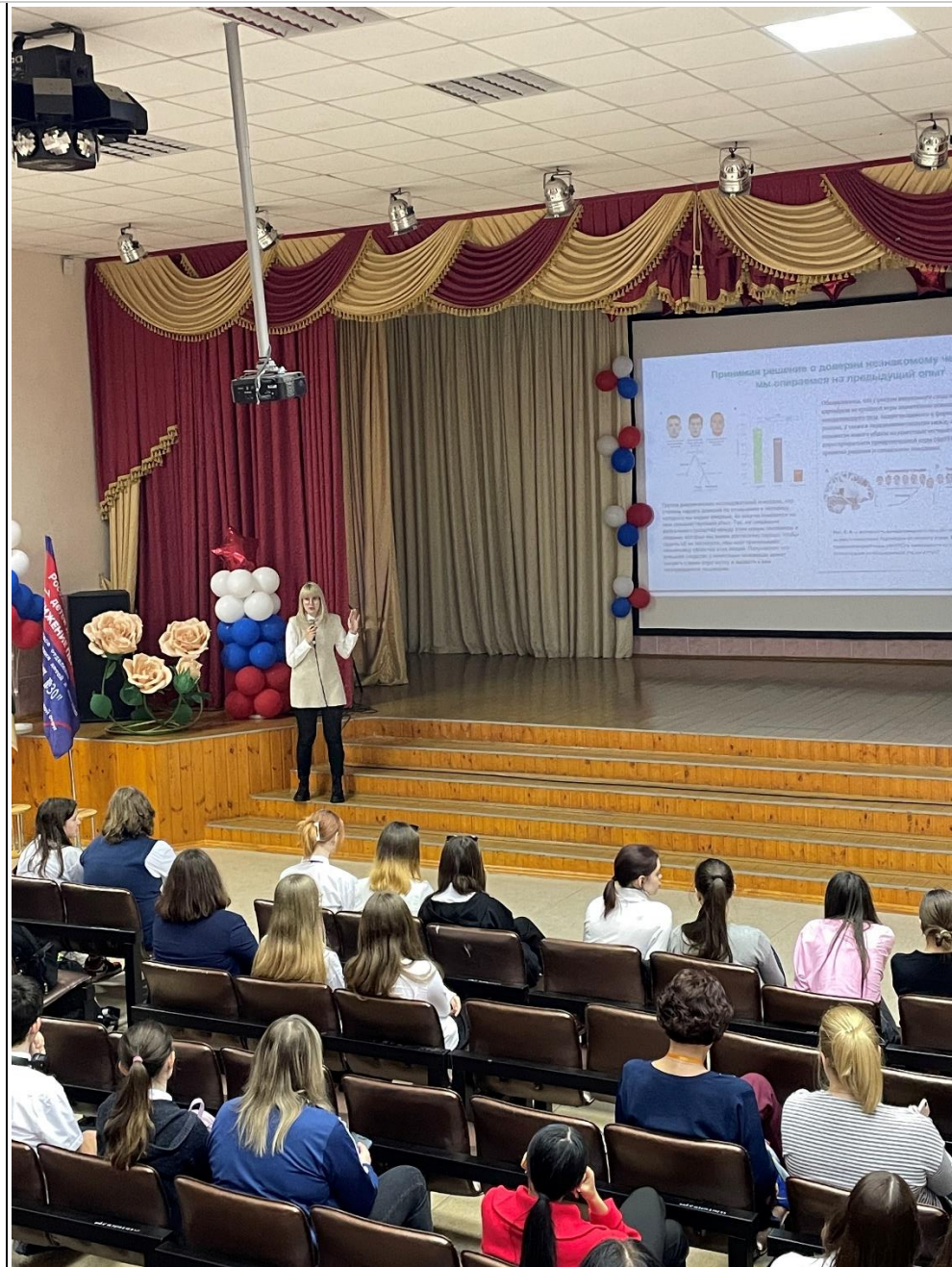
6 Мастер-класс для школьников «Новая эра ВКонтакте»